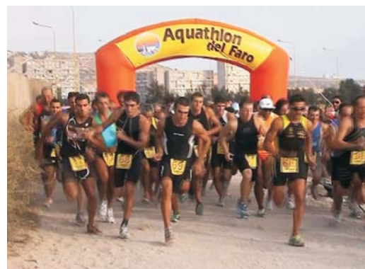
La partenza dell'edizione 2007

€ 15 per iscrizioni sul campo fino a 1h prima della partenza. Iscrizioni gratuite per le categorie giovanili. Accompagnatori Pasta Party € 5.